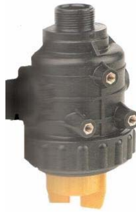
Duza fantip L-30VP02F110